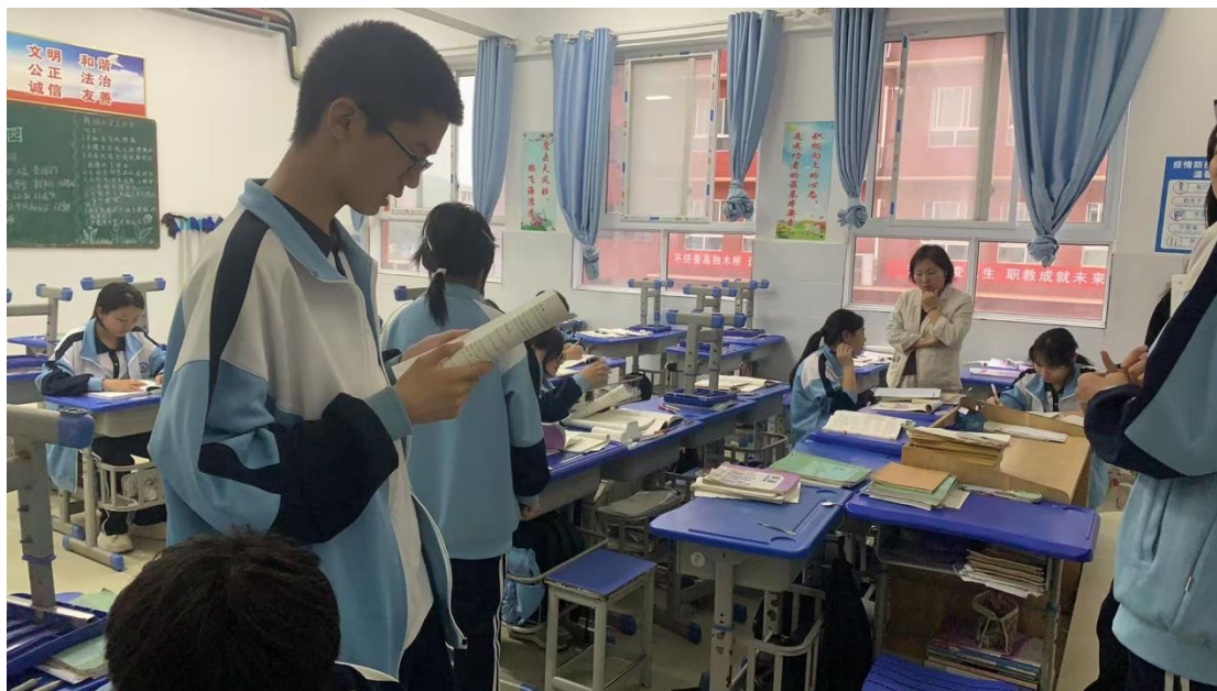
图 2.3.3-1 课后随机抽查

教学质量是学校的生命线，学校聚焦教学常规管理的精细化，在“细”字和“实”字上做文章，将管理要求落细、落小、落实，向教学的每个环节要效益，着力提升教学质量。