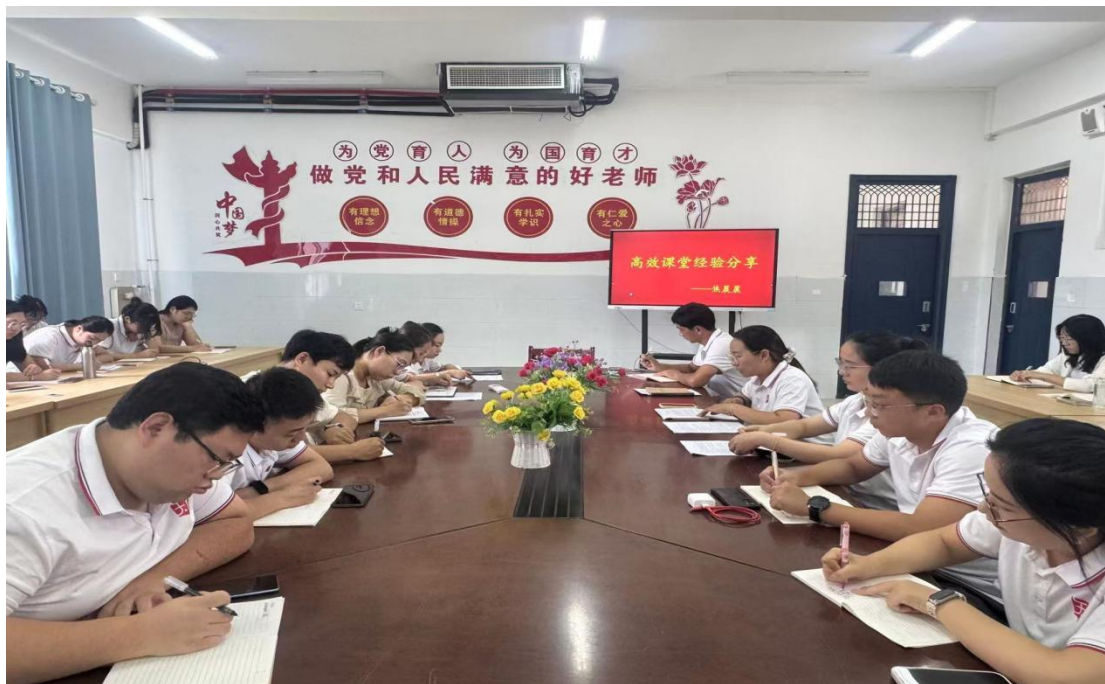
图 2.3.5-1 教师工作经验分享活动