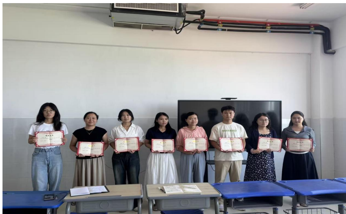
图 4.1-3 优秀教师表彰

学校以此表彰会为契机，向全体教师发出倡议，引导大家以“四有”好老师为根本遵循与行动标杆，坚守立德树人初心，践行铸魂育人使命。全体教师立足中职教育办学特色，主动将红色教育理念融入课堂教学、技能实践、校园活动的全过程，通过讲授红色故事、开展红色研学、组织红色主题班会等形式，把红色基因根植于学生心田；同时秉持言传身教的育人准则，以高尚的师德师风、扎实的专业学识、无私的奉献精神，影响和带动每一位学生，助力学生成长为德技并修、心怀家国的高素质技能型人才。