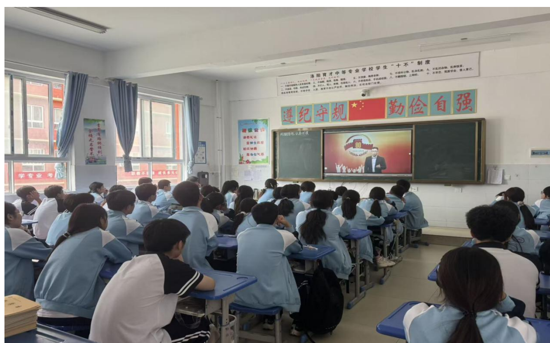
图 4.1-1 学习红色精神

以党建为核心，深化党性教育与教育教学深度融合，将红色基因融入育人全过程。结合抗战胜利 80 周年纪念活动，组织师生集中观看阅兵仪式，召开“弘扬伟大抗战精神，做光荣自豪中国人”主题班会，同步收看思政大课，引导师生铭记历史、缅怀先烈；