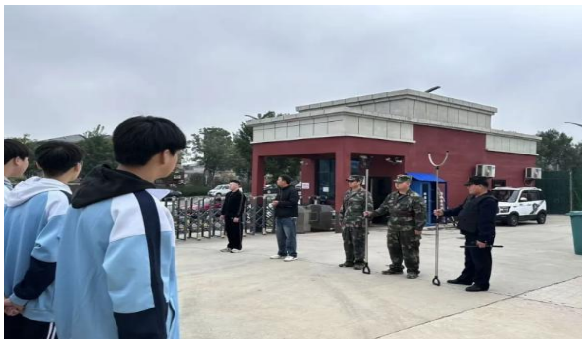
图 2.4.3 校园反恐防暴活动

精准帮扶，从源头上化解矛盾隐患。得益于这一系列扎实举措，该校全年未发生一起校园欺凌事件，为学生成长营造了安全、和谐、清朗的校园环境。