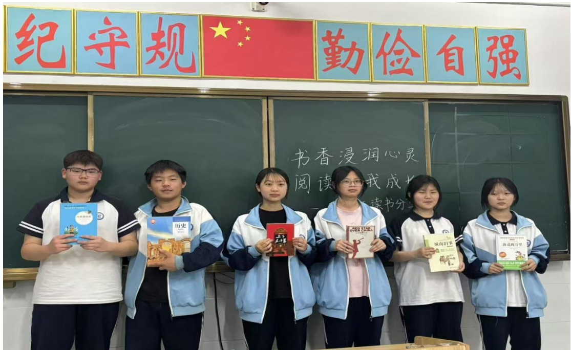
图 2.1-2 书香浸润心灵，阅读伴我成长