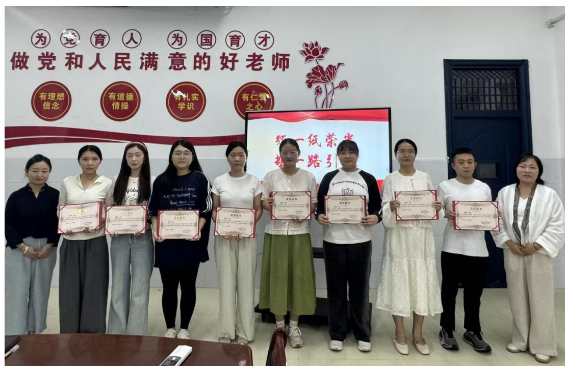
图 2.1-5 “师徒结对”活动

通过分层施策、精准发力，学校逐步构建起青年教师快速成长、骨干教师示范引领的良性发展格局，在全校范围内营造出“比学赶超、争当先进”的浓厚教研生态。