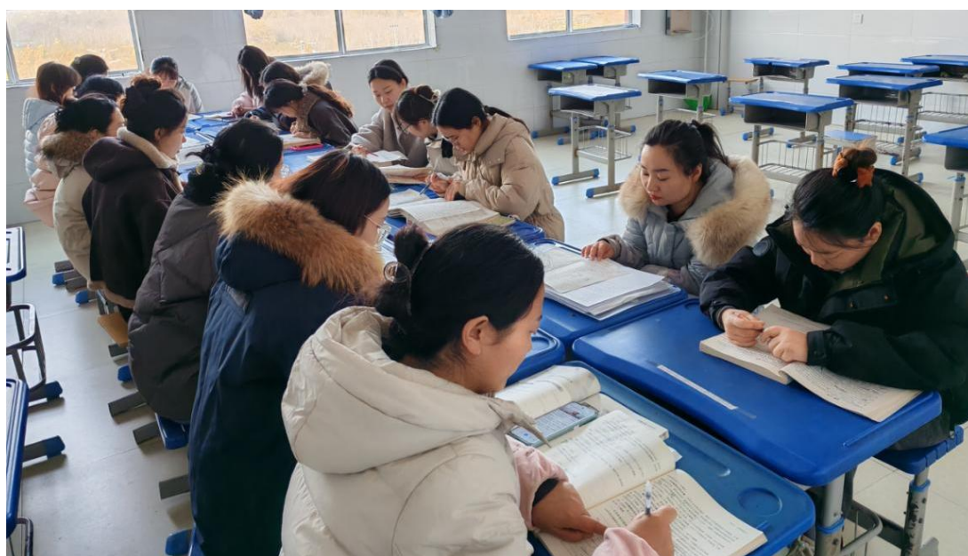
图 2.1-4 学科组教研

搭建专业成长平台：实施“双培养”工程，把骨干教师培养成党员、把党员培养成教学骨干，开展“备课共研、课堂共磨、成果共享”教研活动，促进教师专业提升。