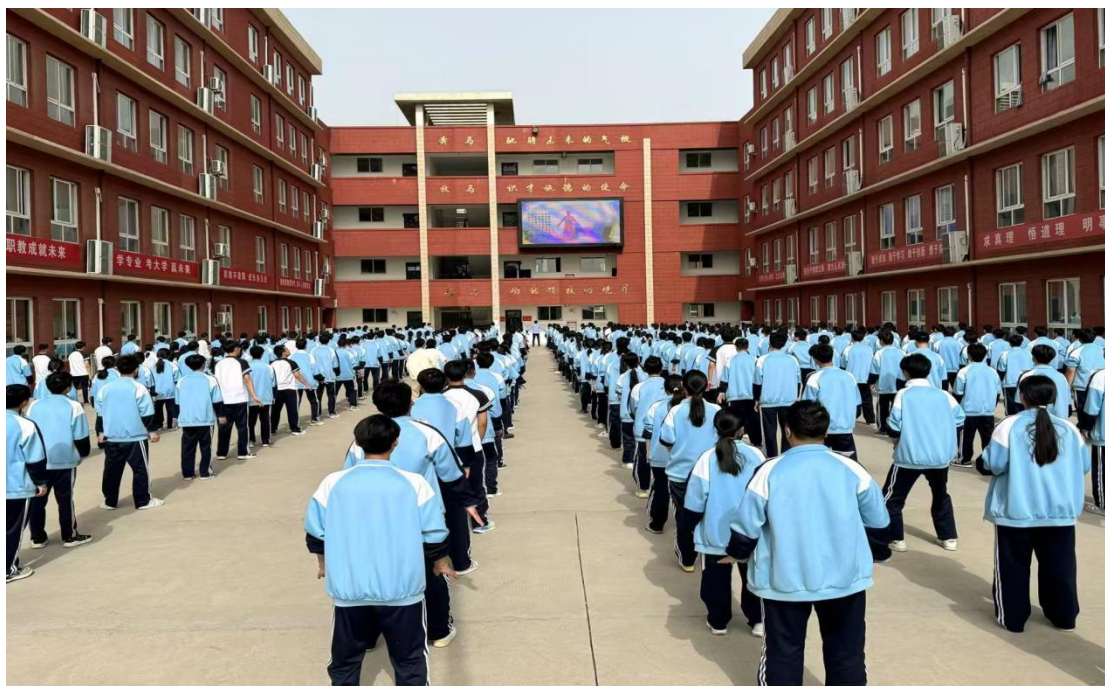
图 2.2-7 特色课间活动

挖掘中华优秀传统文化、红色文化、地方特色文化资源，将美育融入语文、历史、科学等学科教学，开展“古诗配画”“自然美学观察”等跨学科教学活动，实现美育与学科教学深度融合。组建书法、音乐等美育特色社团，定期开展训练与交流活动。