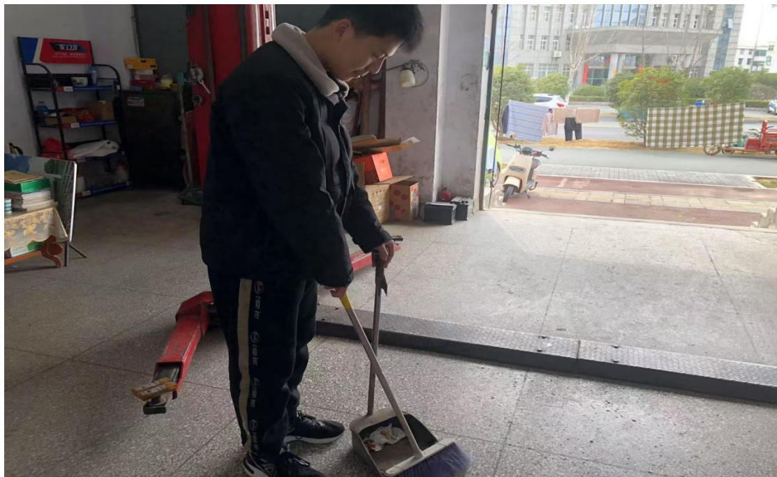
图 4.1-5 “致敬母爱，与爱同行”母亲节活动

母亲节感恩德育实践活动，以“感恩浸润日常”为核心，引导学生在柴米油盐中体味母爱，在亲身实践中体会母亲日复一日的辛劳与付出。学校通过分享会、感悟征文等形式，让学生记录与母亲的暖心瞬间，将感恩之心扎根生活、化作习惯，于细微处回报春晖，让欣慰与幸福常驻母亲眼眸，并使孝亲敬老的传统美德在日常点滴中代代相传。