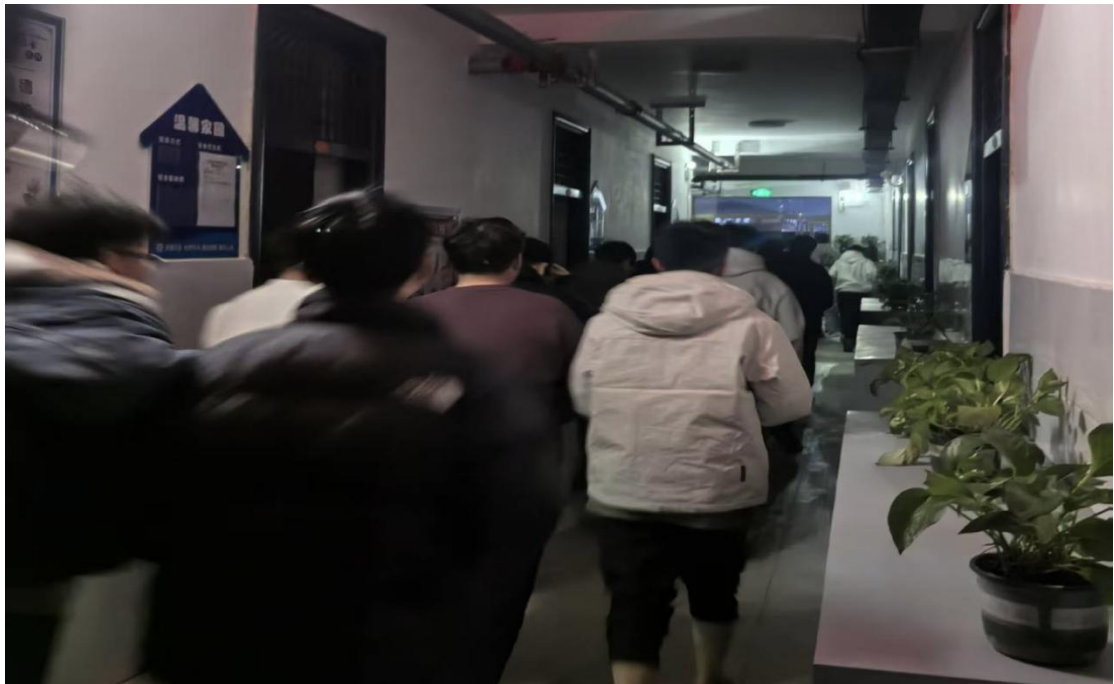
图 2.2-4 宿舍消防应急演练

紧紧扣“人人讲安全，个个会应急”主题，面向全体教职工组织开展了一场内容详实、实操性强的安全专项培训，切实强化教职工安全责任意识与应急处置能力，筑牢校园安全防线。