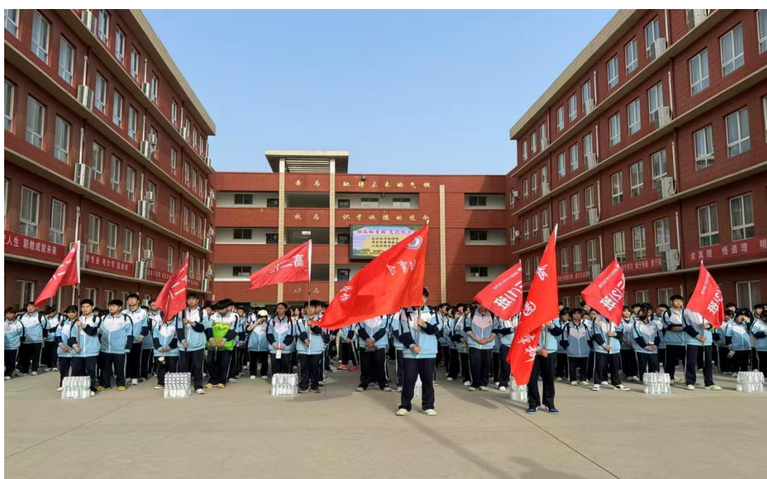
图 4.1-2 “踏青远足长征”活动

开展“踏青远足长征活动”，以沉浸式实践教学厚植学生的红色情怀。活动中，学校精心规划模拟长征路线，引导学生沿着红色足迹徒步前行，在跋山涉水的过程中切身感受长征路上的艰辛与不易；同时，通过沿途讲述红军长征的感人故事、传唱红色经典歌曲、开展红色主题分享会等形式，让学生在行走中重温峥嵘岁月，深刻领悟长征精神的丰富内涵。此次活动不仅锤炼了学生的意志品质，更有效强化了他们的爱国情怀与责任担当，推动红色基因融入血脉、代代相传。