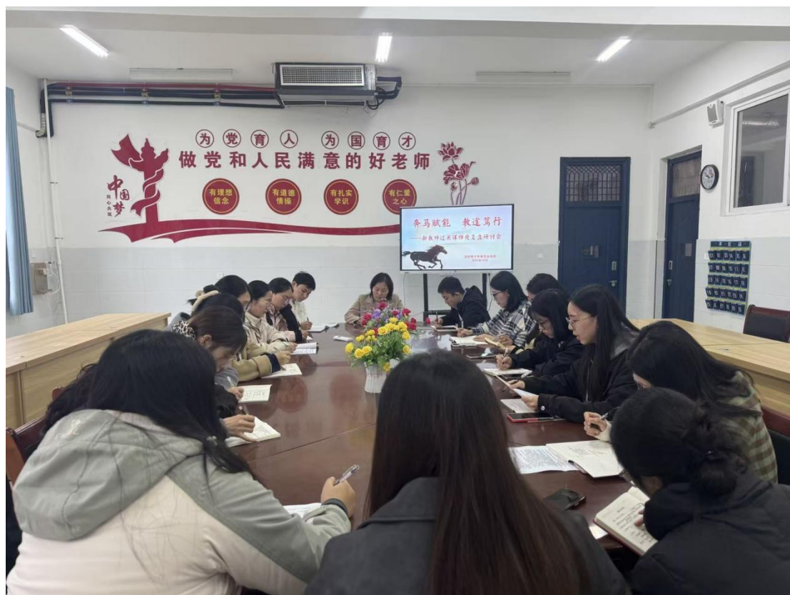
图 4.4-1 “奔马赋能，教途笃行”新教师过关课师徒复盘研讨会

通过学科竞赛、教材研读沙龙、职教高考备考专题研讨等活动激发探究热情；以“砺马境界”中“砺能精技”的要求为导向，推动分层教学、探究式学习改革，鼓励师生在知识钻研中追求精益求精，在教研创新中实现自我突破。