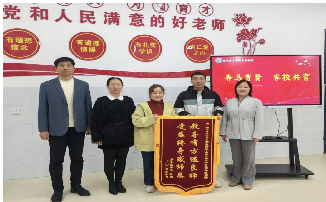
图 2.4-6 “奔马育贤，家校共育” 家长送锦旗

四面锦旗，四份嘱托，更是四份动力。此后，学校将把这份沉甸甸的认可化作甘霖，持续滋养以党建强根基、以师德润桃李的教育沃土，引导全体师者坚守育人初心，携手家长传递殷切期盼，在家校社协同育人的强大合力中，共同护持每一位学子的赤子之心向阳生长，为党建引领下的教育实践写下愈发温暖、厚重的注脚，推动学校教育质量再上新台阶。