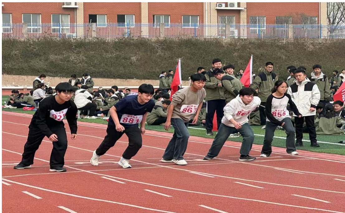
图 4.3-2 “青春逐梦，活力校园”运动会