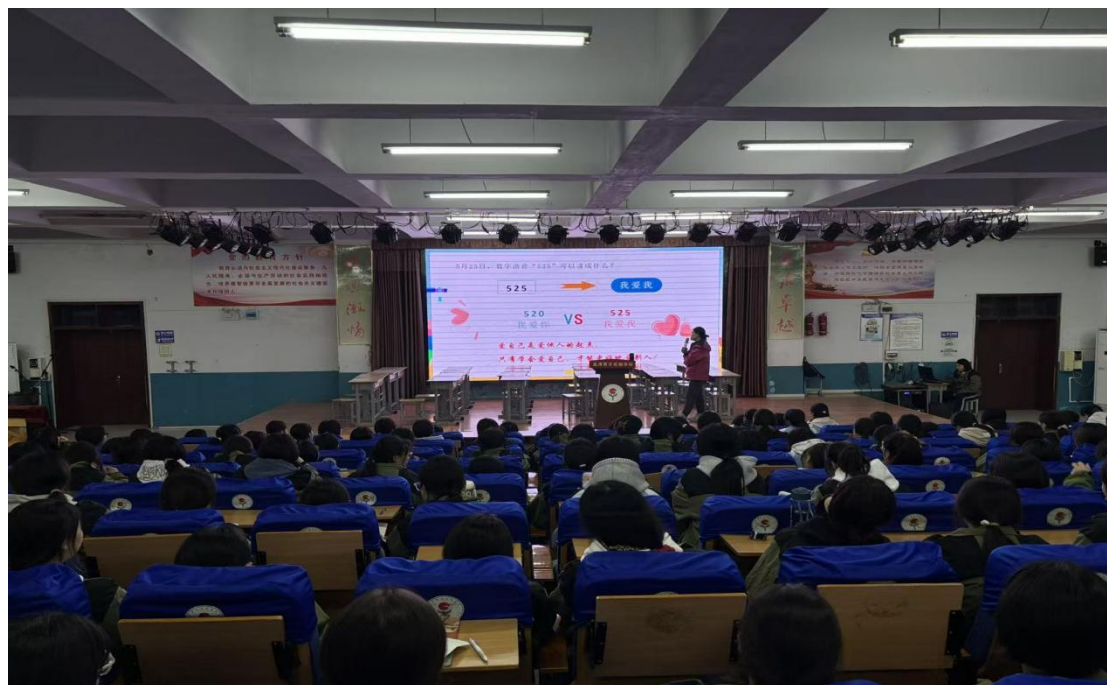
图 2.4-1 女生会议

导活动，内容涉及青春期心理调适、自我保护意识培养、人际交往礼仪等，全方位呵护学生身心健康成长，为学生的全面发展保驾护航。