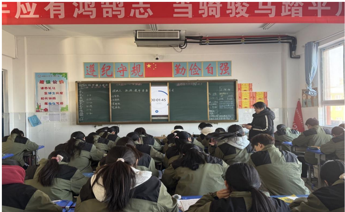
图 2.3.2-1 专业课课堂

在课程实施创新上，主动打破传统教学模式的束缚，积极融入“二四三”教学法、分层教学等特色模式，立足中职教育的职业导向与学生的认知差异，构建起因材施教、精准施教的课堂教学体系。针对不同层次学生的学习能力与发展需求，教师制定差异化教学目标与个性化辅导方案，让基础薄弱的学生夯实知识根基，让学有余力的学生拓展技能边界；同时，紧扣行业发展趋势与岗位核心能力要求，将最新的行业标准、岗位规范、技术流程有机融入课程教学的各个环节，确保课堂内容与生产实践无缝对接，让通过持续优化课程内涵、创新教学路径，学校以高质量课程建设为核心，为学生学业进阶、技能成才与职业发展筑牢坚实基础。