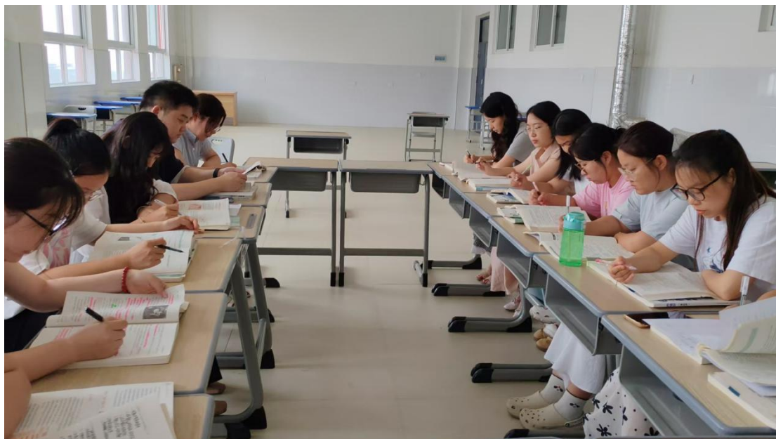
图 2.3.3-2 学科组教研