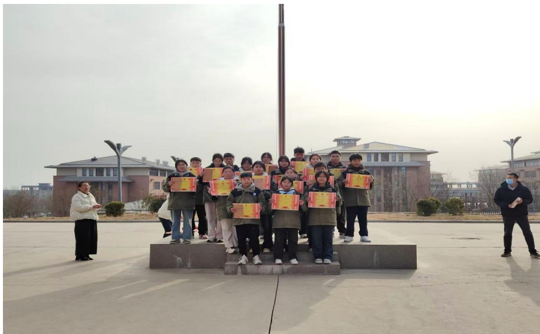
图 2.2-1 榜样学生表彰活动

共青团，是一个充满活力与激情的先进青年组织，更是广大青年在实践中学习中国特色社会主义和共产主义的重要阵地。在我校，共青团汇聚着一群怀揣梦想、积极向上的热血青年，他们在这里淬炼品格、增长才干，绽放青春光彩，追逐时代理想。