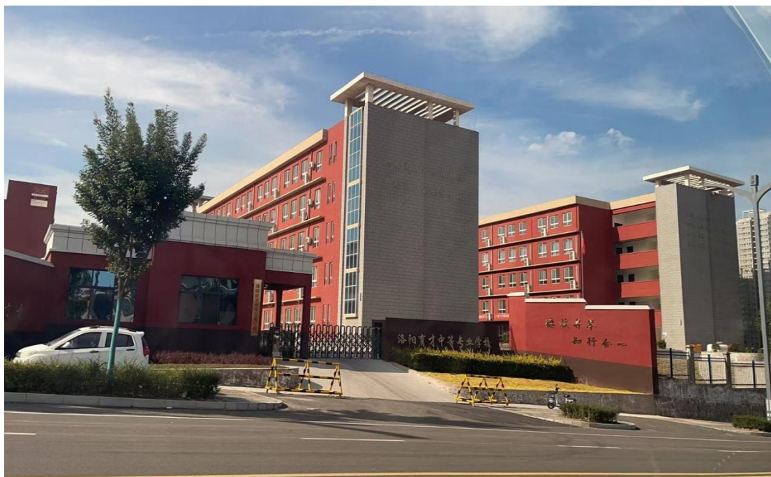
图 0.1-1 校园全景图

洛阳育才中等专业学校和孟津育才实验学校都隶属于江苏育才教育集团，在管理团队、师资队伍、硬件设施、管理模式、教育教学等方面资源互享、深度合作。学校以“和谐 争先 守规 爱校”为校风；以“勤业 博学 务实 创新”为校训；以“尊重、赏识、激励、不放弃每一个学生，宽严有度，关爱有加。”为宗旨，以“让中考成绩中等及以下学生考上本科”为目标，使每一个学生有学头、有盼头、有奔头！