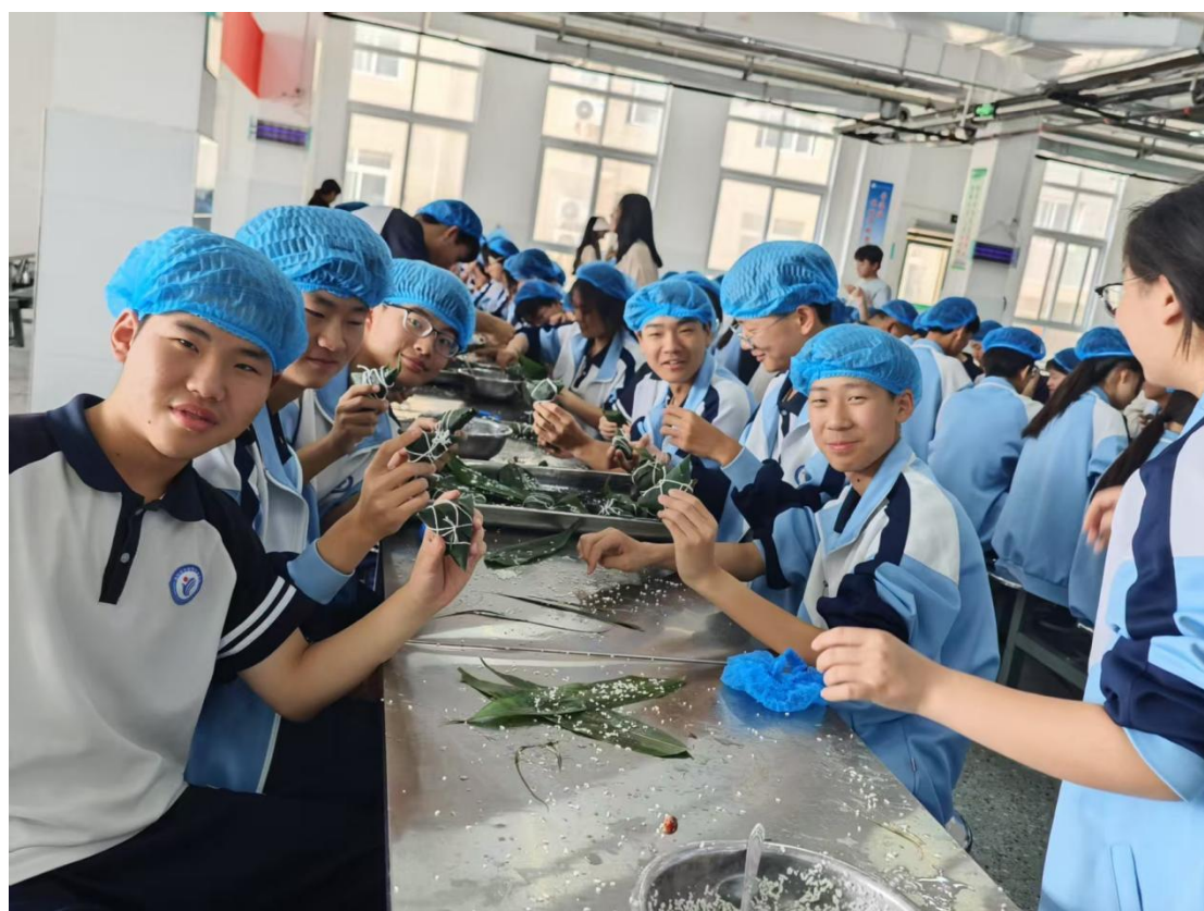
图 4.1-6 “端午粽飘香，师生情意长” 包粽子活动

包粽子主题实践活动，让学生在亲身体验中熟练掌握了一项传统手工技能，有效提升了动手实践能力与劳动素养，更在小组协作的过程中增进了同学之间的情感联结，培养了团队合作意识。同时，学校以传统文化为重要载体，将爱国精神与修身品格的培育融入活动全程，潜移默化地引导学生感悟传统文化中的精神力量，使学生将个人成长与国家发展紧密结合，把浓浓的爱国情感转化为勤学苦练、锤炼技能的实际行动，为成长为担当民族复兴大任的时代新人筑牢根基。