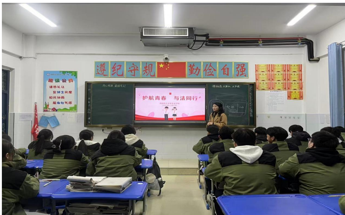
图 2.4-2 主题班会

以《中小学生守则》为准则，通过主题班会、行为规范竞赛、文明班级评选等活动，强化学生仪容仪表、课堂纪律、校园礼仪等方面的养成教育。建立“日常巡查+定期评比”机制，开展“文明宿舍”“行为示范岗”活动，学生行为规范合格率高。