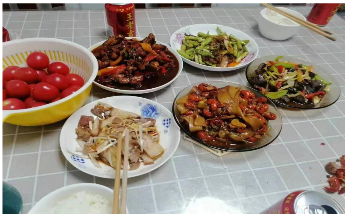
图 4.1-4 “劳动传暖意 感恩润心田”行动

活动立足中职教育特色，结合种植类专业优势，设置了作物种植实操、农耕文化研学、红色故事分享等丰富环节。在劳动实践现场，学生们分组参与整地、播种、育苗等农事劳作，亲身体验农耕过程的艰辛与乐趣；在农耕文化研学中，通过参观校史农耕陈列馆、聆听农技专家讲解传统农耕技艺，深入了解中华农耕文明的悠久历史与独特魅力；在红色故事分享会上，师生共同追忆革命先辈艰苦奋斗的峥嵘岁月，感悟红色基因中蕴含的劳动精神与担当力量。