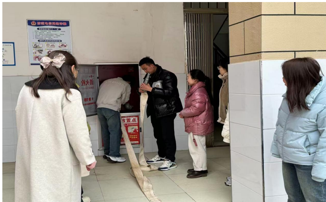
图 2.2-3 消防器材使用培训

进行手把手教学与实操考核，确保每位教师都能熟练掌握消防技能，成为校园消防安全的“第一响应人”。