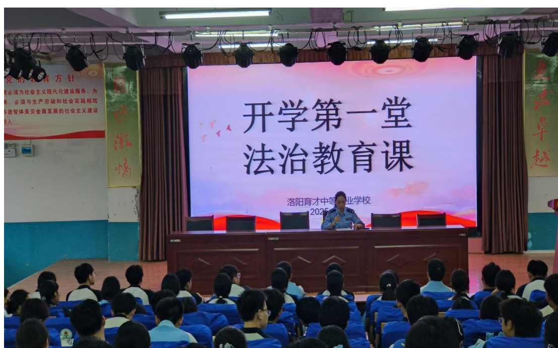
图 2.4-4 法制教育课活动

化普及消防安全、交通安全、防溺水、防校园欺凌、防电信诈骗等安全知识要点，做到安全教育时时有、处处在。此外，学校建立安全法治教育长效机制，定期开展知识考核与实操测评，检验教育成效。通过系统化的教育举措，该校学生安全知识知晓率达 100%，法治观念与安全防护能力得到显著提升，为营造平安和谐的校园环境奠定了坚实基础。