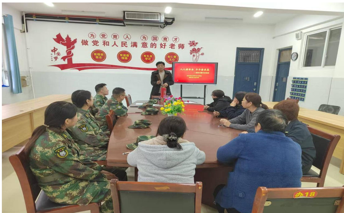
图 2.2-5 “个个讲安全，人人会应急”会议

安全教育方面，学校坚决摒弃“说教式”“填鸭式”的传统教学模式，立足中职学生的认知特点与成长需求，精心组织消防演练、防溺水实操培训、交通安全情景模拟等一系列沉浸式、体验式主题教育活动，让安全知识从书本走向实践，让防护技能在实操中落地生根。