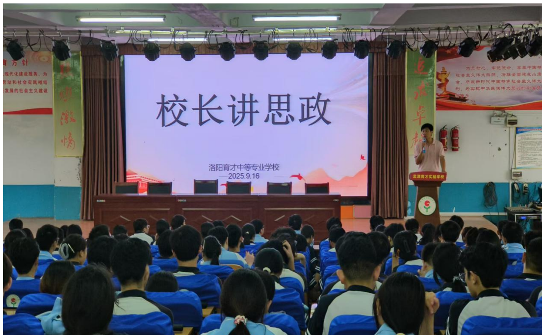
图 2.1-1 感悟思想伟力，勇担时代使命

丰富主题教育活动：常态化开展“技能成才 强国有我”“红色故事我来讲”等主题活动，通过红色经典诵读、主题团日、志愿服务等形式，厚植学生家国情怀。