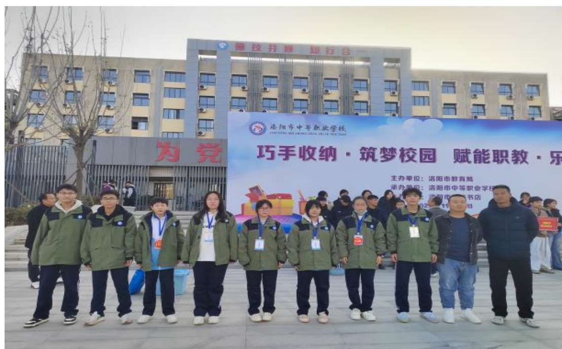
图 4.4-2 “巧手收纳，筑梦校园”活动

一系列特色文化举措，将奔马文化的精神烙印与“五育并举”的育人要求深度融合，让师生在常态化的实践锻炼中砥砺德行、精进技艺，在丰富多元的文化活动中凝聚合力、驰骋成长，彰显学校“铸志协力，驰骋未来”的发展风貌。