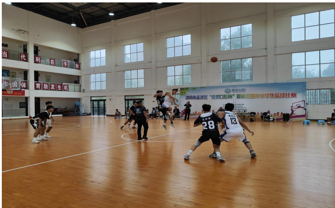
图 4.3-1 参加孟津区篮球比赛

体育赛事活动，涵盖年级班级篮球联赛、2025 年春季田径运动会，以及赴一高、二高的校外篮球友谊赛、赴二高的足球友谊赛等丰富内容，为学生搭建起展示青春风采、释放运动活力的广阔平台。