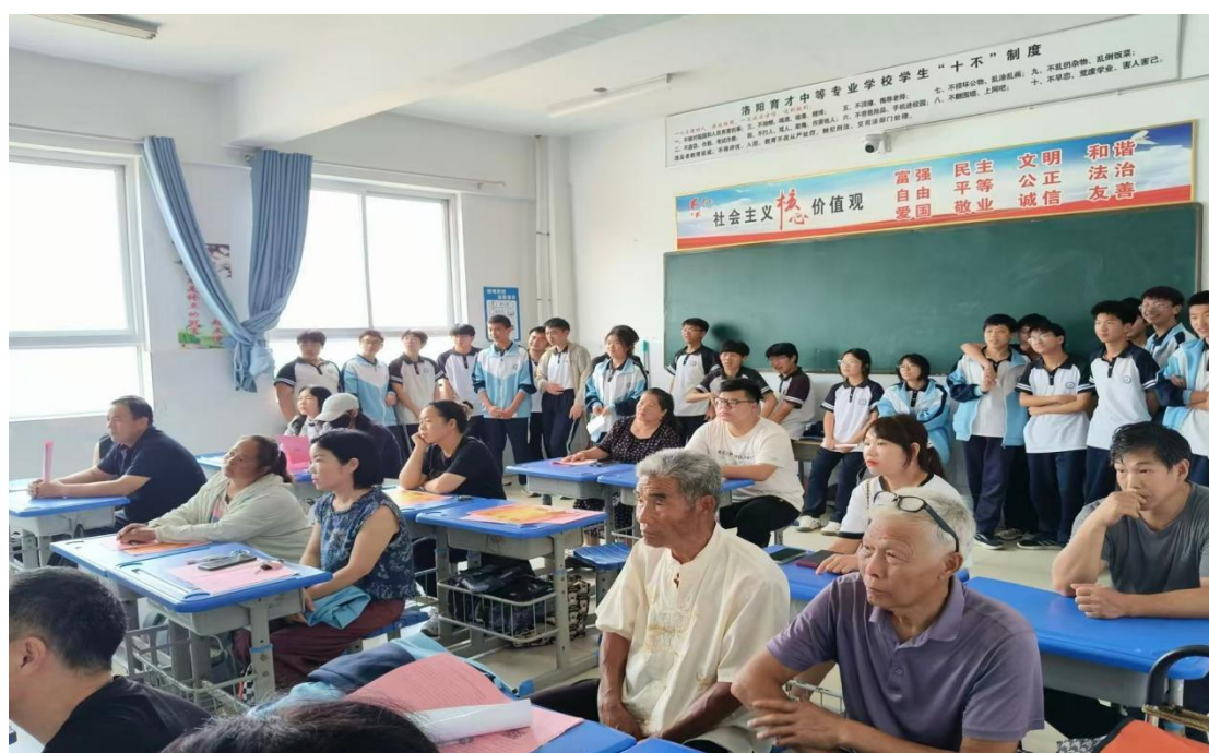
图 2.4.5 “家校同行，共育未来” 家长会活动

家长清晰反馈阶段性成长优势与针对性改进方向，实现家校共育的同频共振。学校全年严格依据测评结果，公平公正评选“新时代好少年”“优秀学生干部”“文明标兵”等荣誉称号，通过校园宣传栏、广播台、表彰大会等渠道进行事迹宣讲，充分发挥榜样的示范引领作用。一系列举措有效激发了学生的内生动力，在校园内营造出“比学赶超、奋勇争先、全面发展”的优良成长氛围。