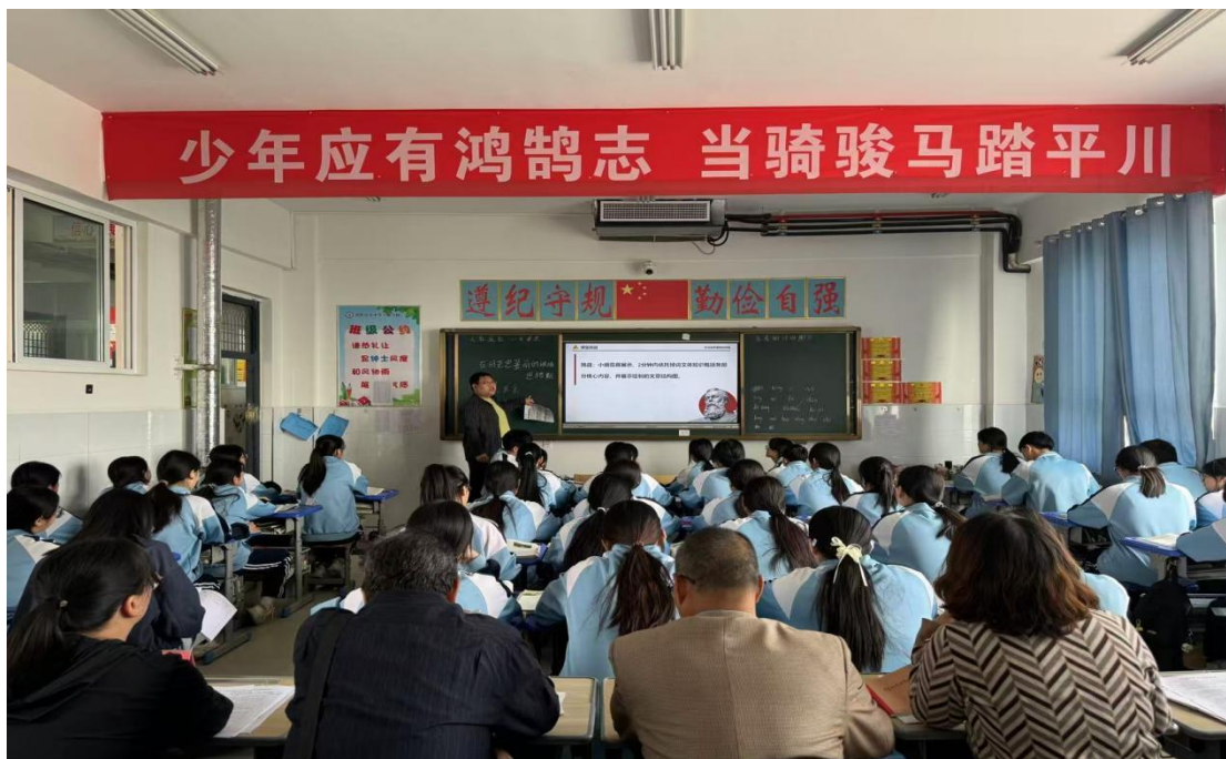
图 2.3.3-3 教师听评课