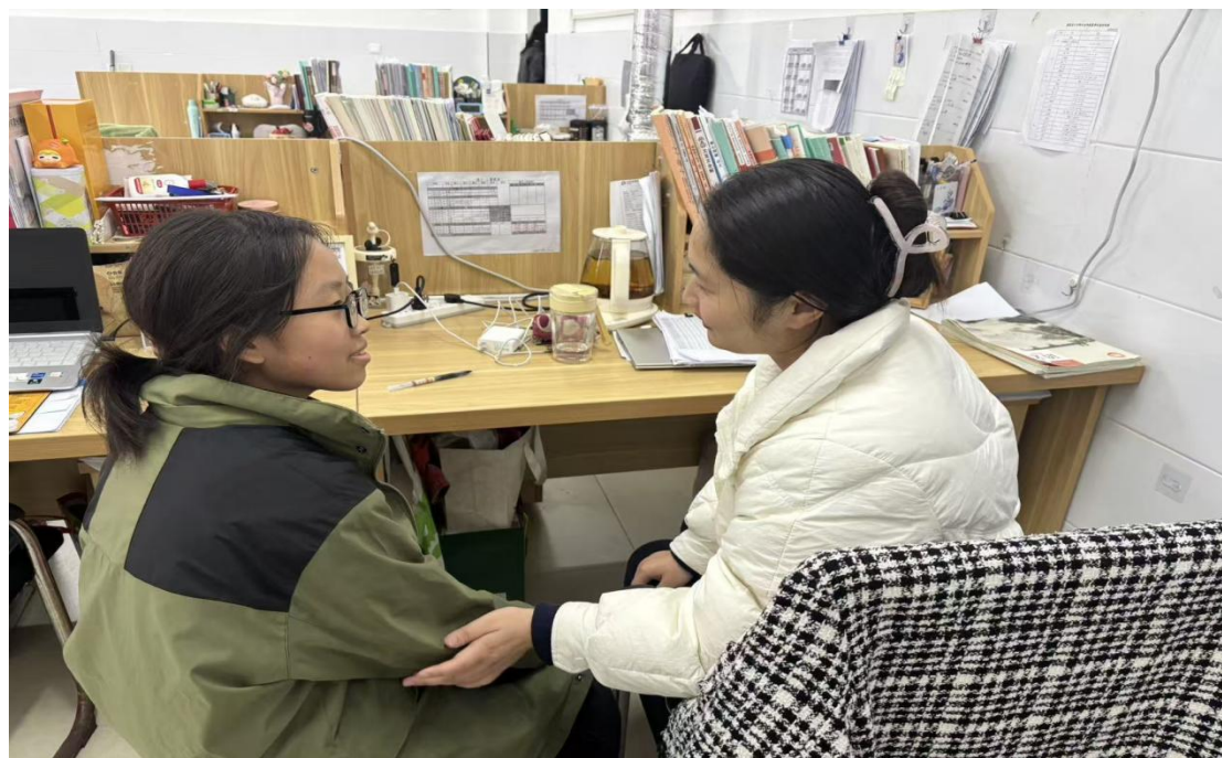
图 2.2-2 师生交流

势给予针对性建议，全方位关注学生的身心健康成长，真正让德育工作融入日常、落到实处，助力学生成长为德技并修的高素质技能型人才。