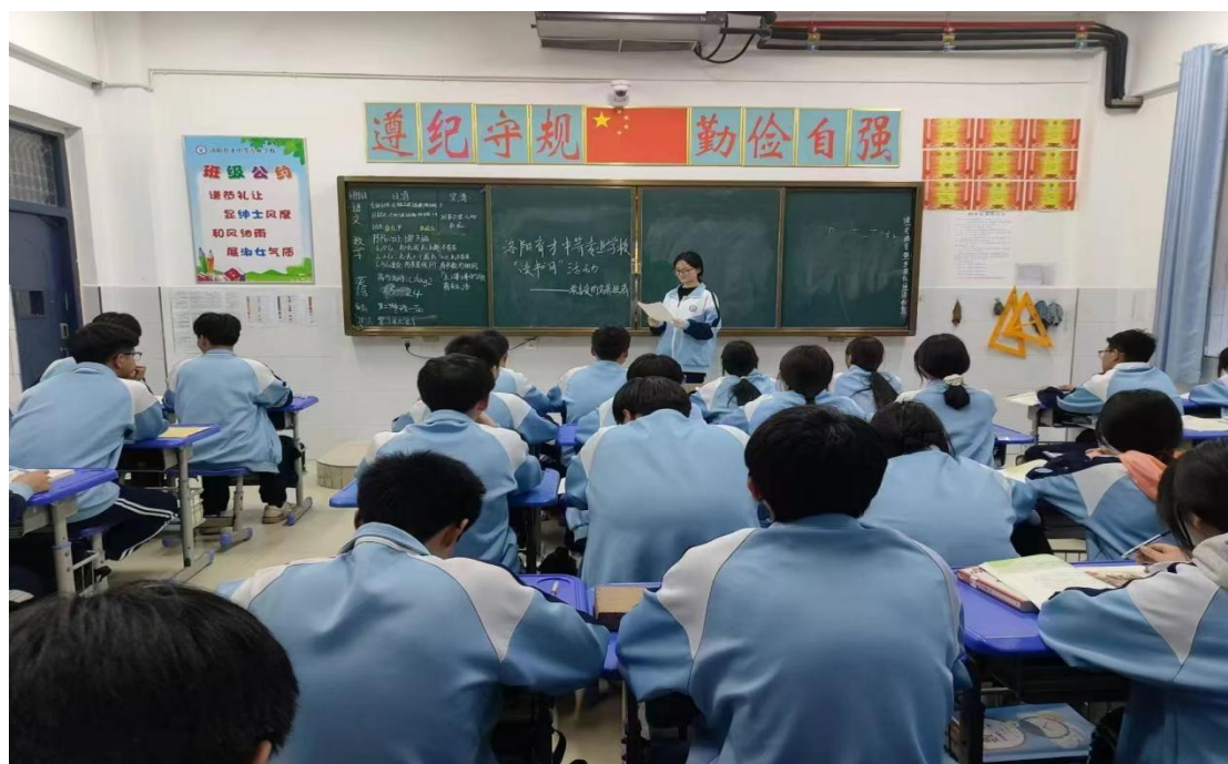
图 4.1-7 “品书香之气，享阅读之乐”读书月活动

读书月活动中，以“共读经典，传承文脉”为核心，师生携手品读经典名著、吟咏诗词歌赋，感悟中华优秀传统文化的魅力，于共读互鉴中涵养人文情怀，让经典文化在校园中代代相传。