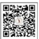
洛阳商业职业学院