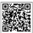
洛阳职业技术学院