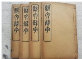
中国第一部字典《说文解字》