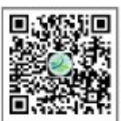
洛阳文化旅游职业学院