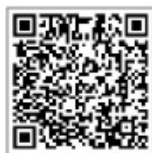
河南推拿职业学院