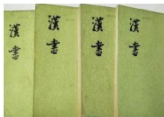
第一部断代史《汉书》