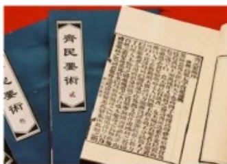
第一部农业科技专著《齐民要术》