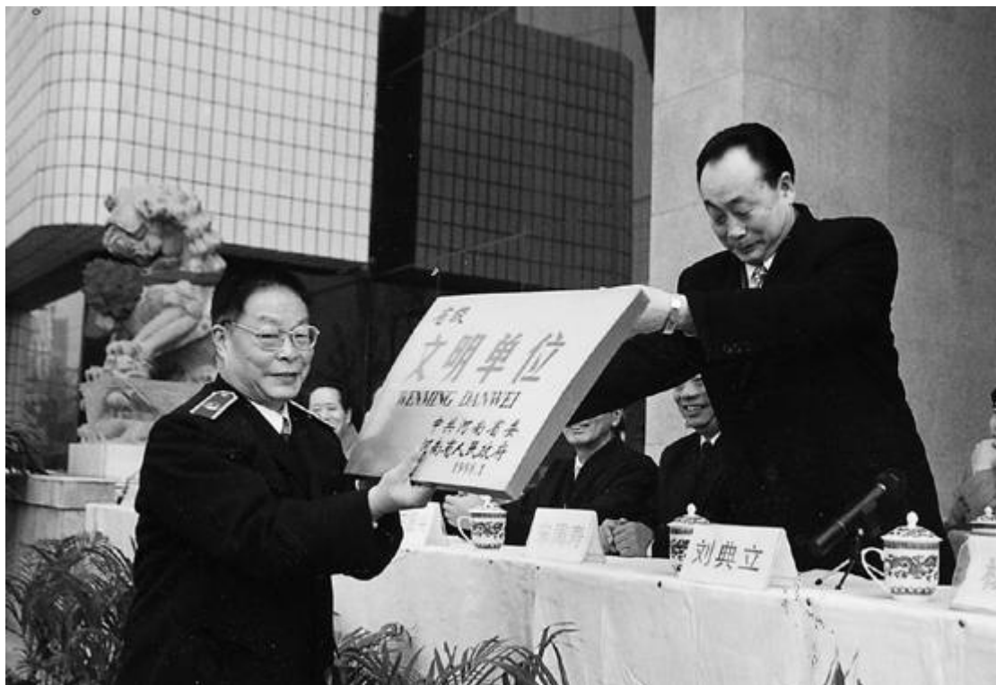
“文明单位”授牌仪式 照 大事记—8