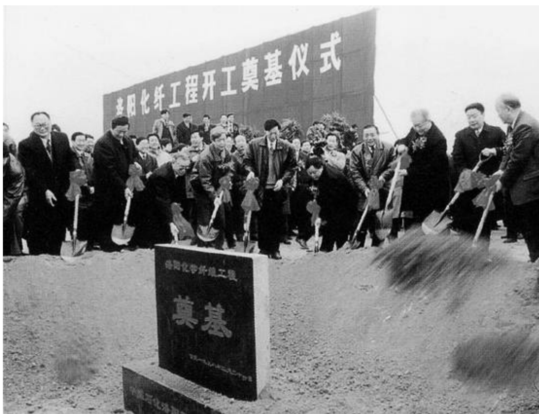
洛阳化纤工程开工奠基仪式 照 大事记—1

△ 由市委组织部等 6 个单位联合评出在经济建设中建功立业的“青年十杰”：六一三所高级工程师丁贤澄、伊川电业局技术干部刘志敏、洛阳烧伤医院院长肖建勋、市建设银行会计员杨慧丽、汝阳县三八林场农民杨跃娟、市公安交警班长周洛生、棉纺织厂挡车工邓志芳、市标准件公司经理毕德周、豫西农专基础部党总支副书记张赞平、洛阳酒家服务员高艳芳。