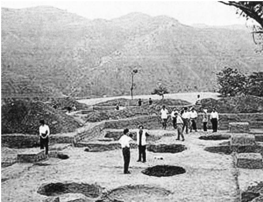
妯娌遗址发掘现场 照 大事记—5

4 日 市国泰服装（集团）公司引进的服装 CAD 辅助设计系统投入使用，成为河南省实现服装设计自动化的第一家。