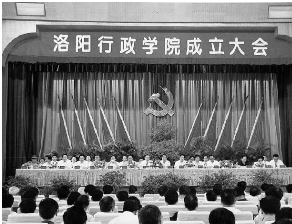
洛阳行政学院成立大会 照 大事记—7

3日 洛阳行政学院挂牌成立。市委决定市委党校兼办洛阳行政学院，洛阳行政学院承担全市国家公务员培训任务。