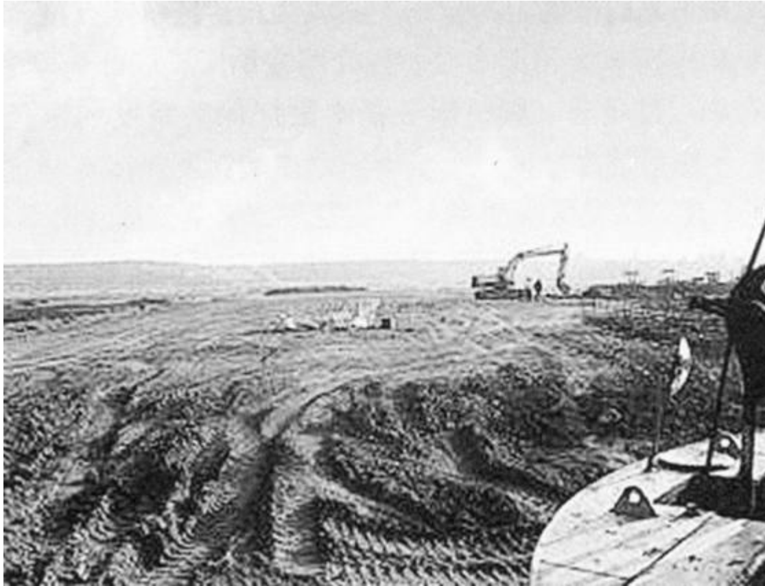
洛界高速公路伊川段施工现场 照 大事记—11